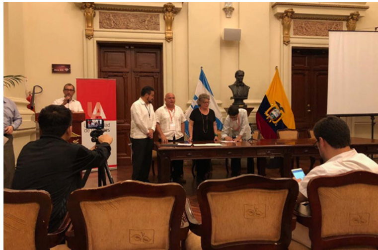
Figura 10: Manifiesto de Guayaquil y la Declaración del CRES 2018, Ecuador 2018

Como resultado de estas reuniones, se generaron el Manifiesto de Guayaquil y la Declaración del CRES 2018; documentos que responden al interés estratégico que estos temas tienen para nuestro Consejo. Con la participación del CAESA se señala la importancia de la formación y promoción artística desde los espacios de la educación superior.