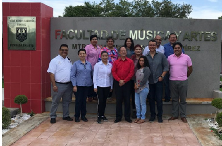
Figura 5: Taller Práctico en la Universidad Autónoma de Tamaulipas