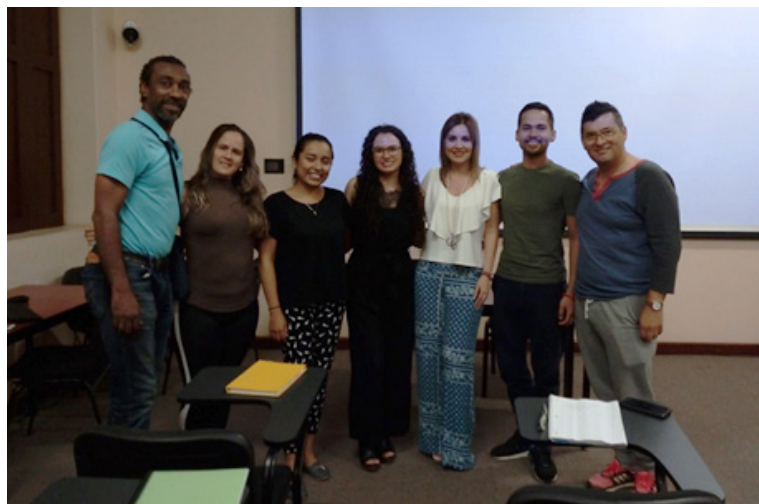
Figura 3: Curso para el Proceso de Evaluación con fines de Acreditación

Un curso se llevó a cabo por solicitud de la Escuela Superior de Música y Danza de Monterrey, el día 8 de junio del presente año, en las instalaciones de la ES-MDM. A la visita acudieron profesores y directivos de la Licenciatura en Danza Clásica Plan Especial para Varones, así como el Presidente, la Coordinadora Técnica, la Asistente Académico del CAESA.