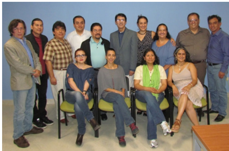
Figura 6: Curso de Formación y Actualización para Evaluadores Analistas

Durante los días 23 y 24 de agosto de 2018 se llevó a cabo el Curso de Formación y Actualización para Evaluadores Analistas en el Centro de Documentación e Investigación de las Artes de la UANL. En el curso participaron 18 evaluadores analistas de nueve Instituciones de Educación Superior del país.