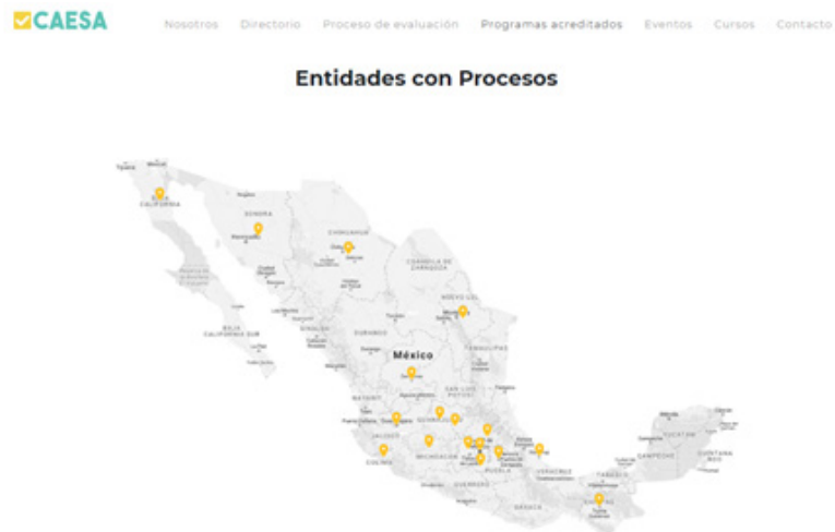
Figura 13: Vista de la página www.caesa-artes.com