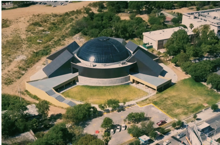
Figura 7: Centro de Investigación de las Artes en la Universidad Autónoma de Nuevo León

Entre las líneas de acción de este proyecto se encuentra la concentración del equipo administrativo del CAESA en una oficina dentro de las instalaciones del Centro de Documentación e Investigación de las Artes de la Universidad Autónoma de Nuevo León (Figura 6), en la ciudad de Monterrey. El equipo de administrativo está conformado por: el Presidente, la Coordinadora Técnica, la Asistente Académico, la Contadora y la Asistente de Presidencia.