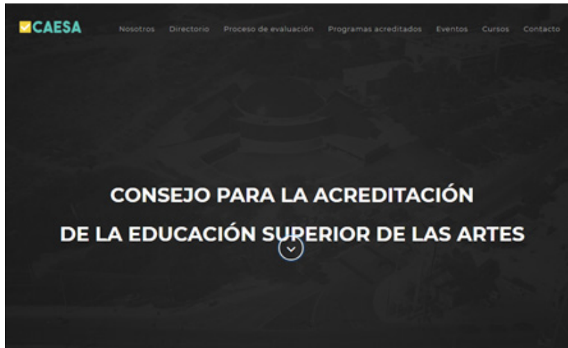
Figura 12: Vista de la página www.caesa-artes.com