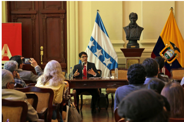
Figura 9: Encuentro por la Calidad en la Educación Superior en Artes, Ecuador 2018