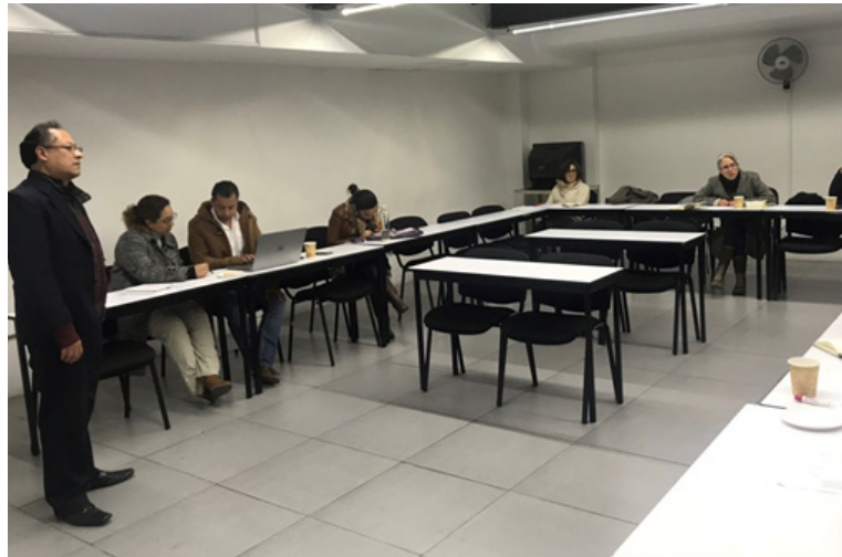
Figura 4: Taller Práctico en el Claustro de Sor Juana