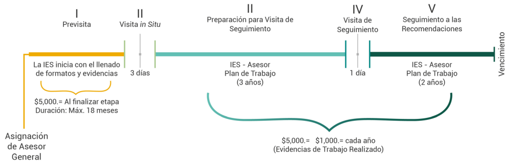
Figura 2: Diagrama del Proceso de Acompañamiento

Cabe destacar que no representa un costo extra para la IES, así como tampoco garantiza ni compromete la acreditación. A continuación se presenta el diagrama del Proceso de Acompañamiento: