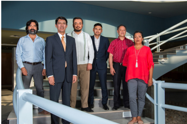
Figura 8: Reunión del Comité de Acreditación, julio 2018

Finalmente, se implementaron reuniones presenciales con el equipo administrativo con el fin de dar seguimiento al cumplimiento de las acciones del Plan de Desarrollo, lo que permite conocer el grado de avance, resolver dudas, proponer mejoras, entre otras cosas. Durante el semestre enero-junio se registraron 30 reuniones administrativas. El Comité de Acreditación llevó a cabo cinco reuniones durante el año que se informa; el día 15 de septiembre de 2017 se reunieron en la Ciudad de México, y en el año 2018 el día 17 de abril en la Ciudad de México, el 26 de enero en línea, mientras que los días 18 y 19 de julio en la oficina del CAESA en Monterrey; y finalmente, el 13 de septiembre en la Ciudad de Xalapa, Veracruz.